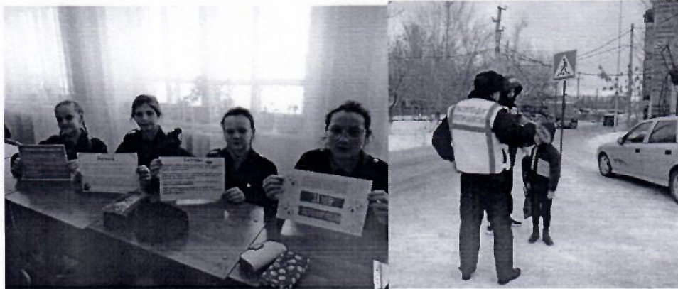
«Быть здоровым - это модно!»