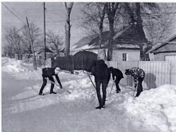
Конкурс «Осенние мотивы»